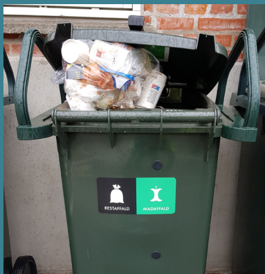
Ukorrekt opbevaring af affald