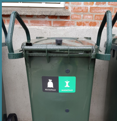
Korrekt opbevaring af affald